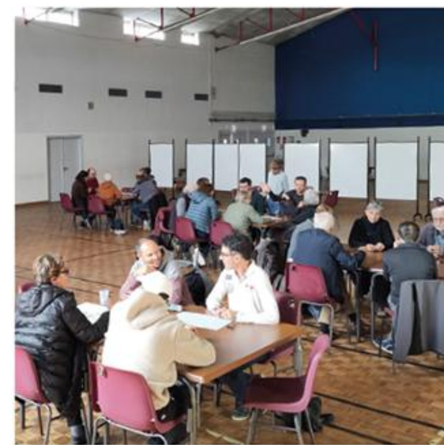
atelier de concertation avec les Melessiens - décembre 2022